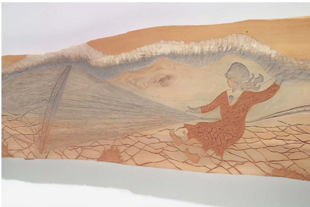
ふるさかはるか《織り Čuoldin Weaving》版木（部分）、2014年