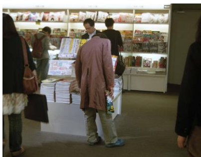
「自分の所有物を街で購入する」2011 パフォーマンスのドキュメントビデオ (3チャンネル) 7' 06 min, 9' 34 min, 6' 06 min

丹羽良徳は、社会の中で人々が当たり前だと考えていたり、見落としていたりする常識や共通の認識、あるいは社会の体制などに目を向け、それに自ら関わる「行為」を作品としています。彼の作品はその行為を記録した映像を中心としており、行為自体が一見無意味だったりユーモラスであったりしますが、私達が知っていると思いついでいる社会や世間といったものが、一体どのような実体を持つものなのかを問いかけるものでもあります。