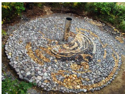
「アナモルフォーシス3 (歩ける彫刻)」 Anamorphosis3, The sculpture you walk on 2005 国際芸術センター青森