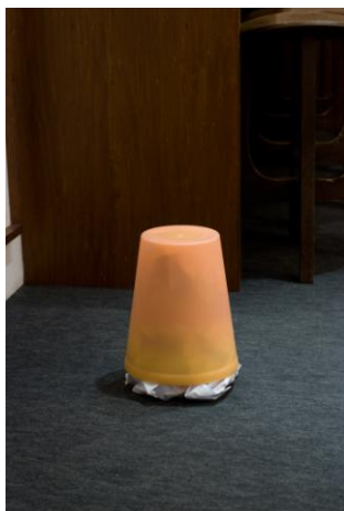
「waste basket and waste paper (orange)」 2011 プラスチック製ゴミ箱、紙 21×h. 28cm