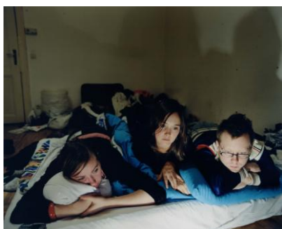
「バンビ、ベルリン」2006 / "Bambi, Berlin" 2006 from the series sight