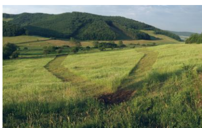
「The turn of the waters」 landscape intervention in Transylvania, トランシルヴェニア、ルーマニア、2007